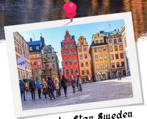
Gamla Stan, Sweden