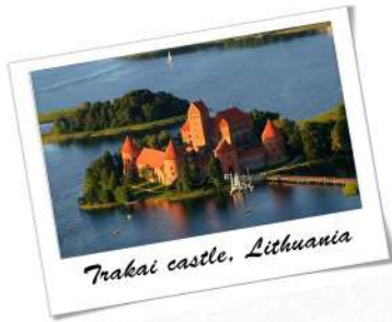
Trakai castle, Lithuania