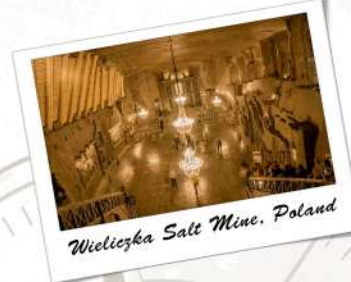
Wieliczka Salt Mine, Poland