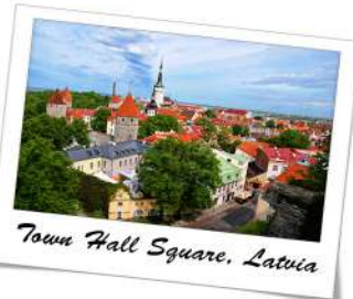
Town Hall Square, Latvia