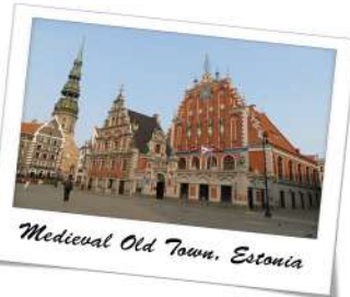
Medieval Old Town, Estonia