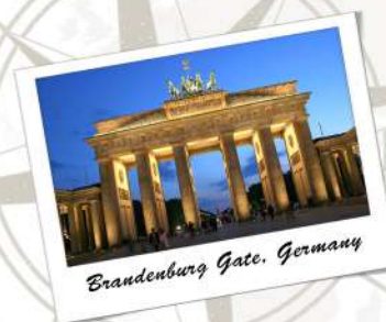
Brandenburg Gate, Germany

Deposit RM2000/pax (NON - REFUNDABLE) HARMONY EXCELLENCE HOLIDAYS No. Account : 8600 505 290 (CIMB)