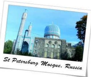
St Petersburg Mosque, Russia